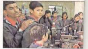
कार्यक्रम को संबोधित करती मुख्य

रोहतक, 15 फरवरी (मनपाल): महर्षि दयानंद विश्वविद्यालय के युआईटी में शनिवार को एक दिवसीय 'अवैयर्नेस कम ट्रेनिंग प्रोग्राम ऑन लोटेस्ट ट्रेड्स इन इंजीनियरिंग' विषय पर कार्यशाला आयोजित की गई।