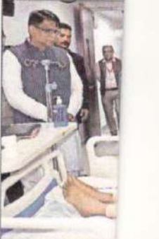
राष्ट्रीय कैसर संस्था मंत्री जे.पी. नड्डा।

उन्होंने कहा कि इस वर्ष हम देश के 200 जिलों में कैसर डे केयर सेंटर शुरू कर रहे हैं