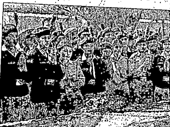
The approval comes after the... of waste treat

Principal D.D.R. College of Education Khandewla (Gurugram)