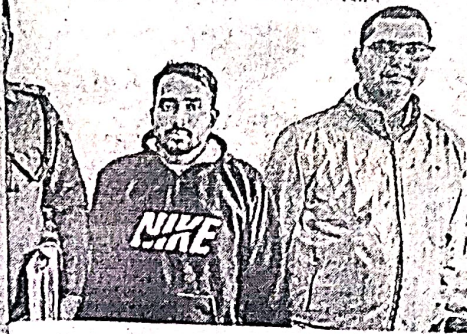
एक कर्मचारी • सौ. पी.आर.ओ.

गुरुग्राम पुलिस ने भी गिरफ्तारी में सफलता मिली है।