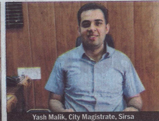
Yash Malik, City Magistrate, Sirsa