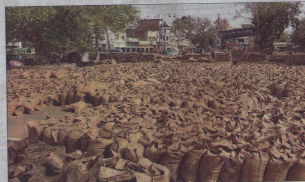
Wheat sacks piled up on the main road in Sirsa grain market due to delayed lifting.

Traders say the delay is affecting both them and farmers — storage is running out, and payments are pending until crops are lifted. "We protested because wheat was not being lifted