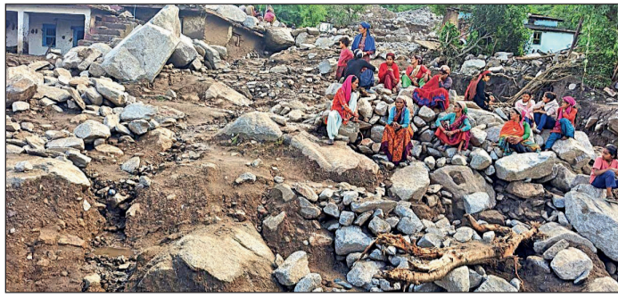
शनिवार को उत्तराखंड के चंपावत में लगातार बारिश से कई घर क्षतिग्रस्त हो गए।

उत्तराखंड और हिमाचल के कई इलाकों में शनिवार को भी भारी बारिश होती रही। गौला की खाड़ी में बने डिप्रेशन से उत्तराखंड के मौसम में अचानक आए बदलाव के चलते हो रही बारिश और भूस्खलन से यमुनोत्री और बदरीनाथ हाइवे का वैकल्पिक मार्ग नंदप्रयाग से कोट कोटियालनेन बंद हो गया। चारधाम यात्रा पर भी असर पड़ा।