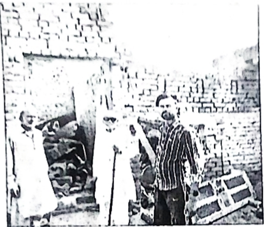
जर्जर मकान दिखाते हुए पार्षद और परिवार। संवाद