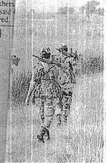
near the Zero Line at the Punjab, in Punjab. FILE PHOTO

'No attack' "The sole aim of the notification is to improve the operational efficiency of the BSF. After a suspect has been detained or a consignment seized within the specified area, the BSF can only conduct "preliminary questioning" and must hand over the suspect to the Punjab police in 24 hours. The BSF does not have the powers to prosecute crime suspects. Thus, it is going to complement and supplement the efforts of the Punjab police. The local police can also act within the jurisdiction of the BSF. Hence, there is no attack on the federal structure," Mr. Kalia added.