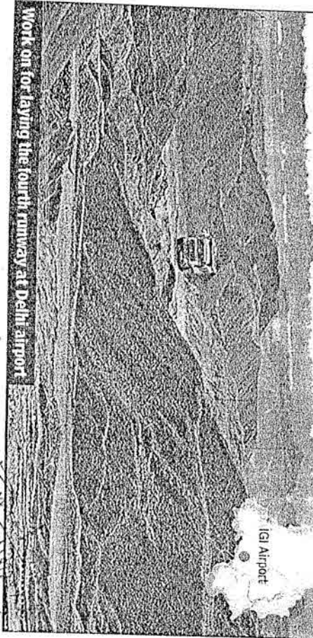
Work on for laying the fourth runway at Delhi airport

from both DIAL and AAI on the issue, but there was no response from them. People in AAI conversant